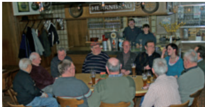
Stammtisch-Pflege ist für die Wirtsleute des „Sterngarten“ wichtig.

„Sterngarten“ setzt seit zehn Jahren auf bayerische Küche