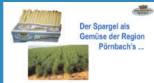
Zu guter Letzt: Die Spargelsaison steht bevor: Die Eröffnung findet am 20.4. um 13 Uhr im Gewerbegebiet Pörnbach statt.