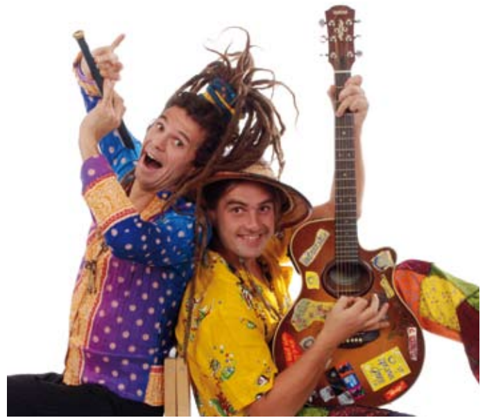
Lustig wird es für die Kids mit „Rodscha aus Kambodscha“

Karten für die Veranstaltung gibt es u.a. im Internet unter www.paarrock.de , im Sportheim Baar-Ebenhausen, bei Schreibwaren Uhlmann in Reichertshofen, Getränke Hörl in Baar-Ebenhausen sowie den Filialen der Hallertauer Volksbank. Die Besucher der Tagesveranstaltung haben die Möglichkeit, zwischen Tickets der unterschiedlichen Kategorien zu wählen: ein Ganztage-