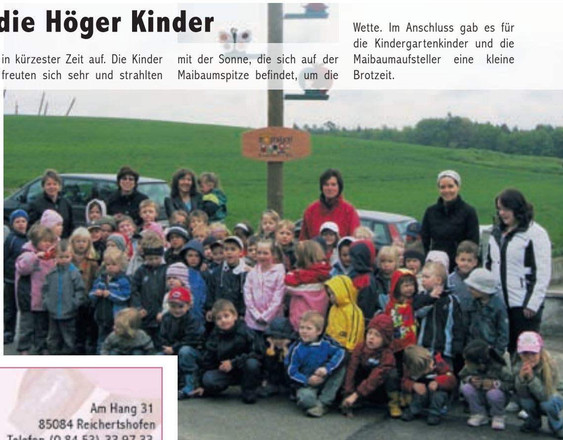
Höger Kindergartenkinder vor ihrem Maibaum.

Wette. Im Anschluss gab es für die Kindergartenkinder und die Maibaumaufsteller eine kleine Brotzeit.