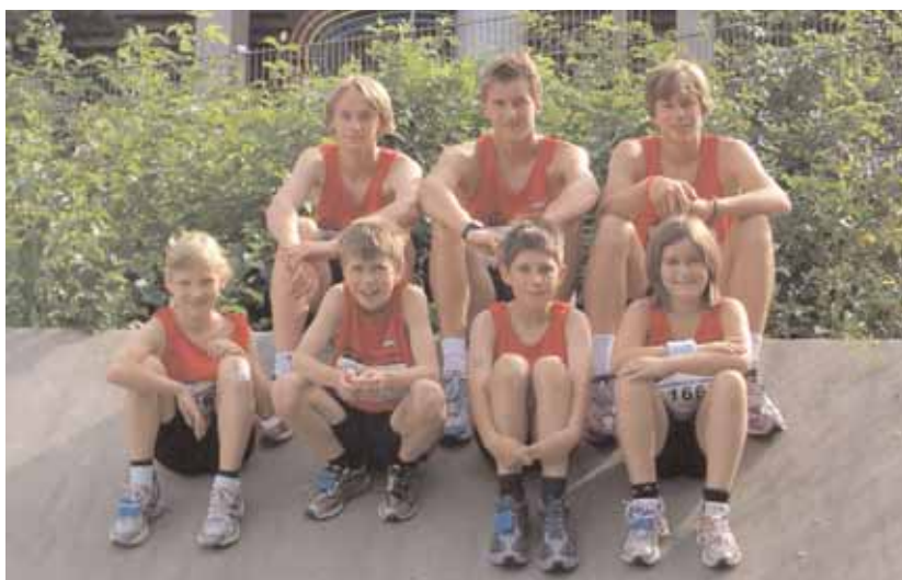
Die Reichertshofer Jugendlichen repräsentieren ihre Heimat sportlich in Bayern.