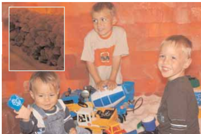
Seit diesem Sommer gibt es in der Region auch ein sog. Salarium - eine Salzgrotte, in der man sich entspannen kann.

Gesunde Menschen finden dagegen unmittelbar eine tiefe Entspannung beim Besuch. Salz ist nicht gleich Salz. Im, an die SalzOase anschließenden, Salzladen gibt es daher verschiedenste Möglichkeiten, Sorten und Informationen. Neben unbehandelten und unjodierten Na-tursalzen aus aller Welt gibt es dort auch exklusive Badesalze und Kosmetikprodukte, Salzkristalllampen in verschiedenen Formen, Lecksteine, Salzbaustoffe, Spezialitäten wie Salzbonbons und Salzsokolade und vieles mehr. Eine Möglichkeit, Salzluft zu atmen und sich zu informieren, ist sich am Sa., 6. September von 10-16 Uhr in der Fichtenstraße 6 in Baar-Ebenhausen.