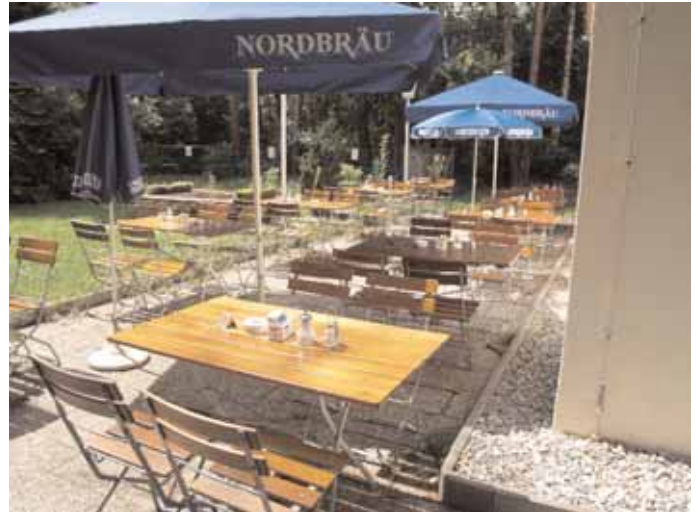
Die Biergartensaison neigt sich dem Ende zu ... auch im Hexenhäusl