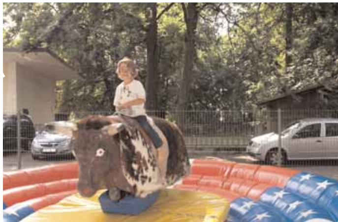
Jede Menge Spaß für die ganze Familie, aber auch Einblicke in die Wild-West-Zeit vermittelt das alljährliche Sommerfest des Club Old West in Baar-Ebenhausen (Ellbogenweg) auf dem Vereinsgelände. (scl)