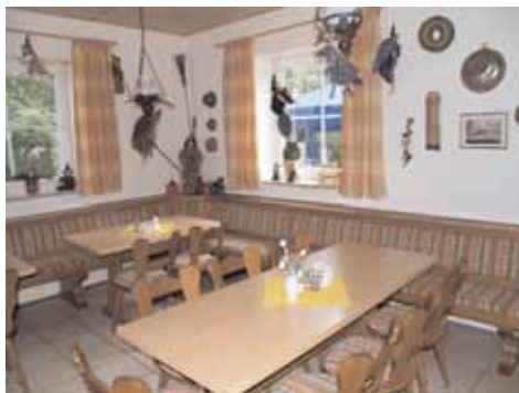
Die Wirtsstube lädt zu gemütlichen Feiern ein.

Ostermeier auflegte. Ihre Ideen und ihr Konzept gehen in Richtung Regionales. Regionalbands und Kabarettkünstler, die das Essen - im Hexenhäusl gibt es bayerische Hausmannskost - entsprechend angenehm und abwechslungsreich gestalten. Die neue Wirtin will mit ihren Ideen zugleich Anlaufstation für ältere, aber auch junge Gäste sein, da das Hexenhäusl keineswegs nur Ausflugslokal ist. (sci)