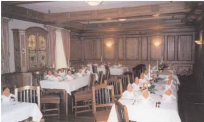
Der Saal bietet Raum für Familienfeierlichkeiten.