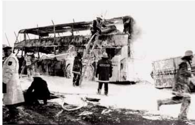
Kein Entrinnen aus der Flammenhölle gab es am 11. Februar 1985 für zwanzig englische Militärmusiker als ihr Doppeldeckerbus auf einen vorausfahrenden, mit Kerosin beladenen Tankwagen auffuhr.

Aber auch von Katastrophen blieb der Markt nicht verschont. Die Chronik erinnert neben der Pest im 17. Jahrhundert an den großen Brand von 1895, bei dem 32 Gebäude, darunter allein 14 Wohnhäuser den Flammen zum Opfer fie-