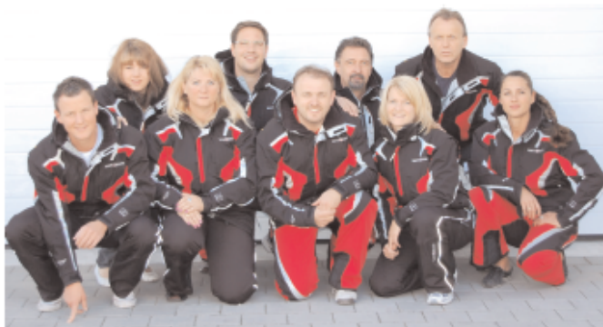
Das Team der Betreuer und Übungsleiter beim TSV Reichertshofen bietet Kurse für Kinder, Jugendliche und Erwachsene.

Sie in den gelb-blauen Programmheften, die in Kürze gestellt bzw. aufgelegt werden. In diesen Programmen werden auch alle