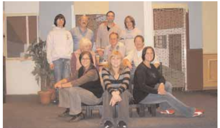
Die Laiendarsteller des Theatervereins spielen ab Mitte November im Pfarrzentrum das Stück "14 Nächte - all inklusive".