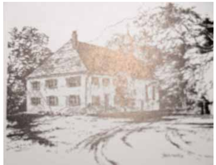
Die Kalvarienberg-Kirche

Am Fest Christi Himmelfahrt treffen sich alljährlich die Jugendlichen zu einem Wallfahrtsgottesdienst auf dem Kalvarienberg.